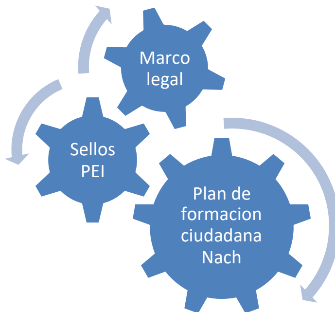
Diagrama 1: El plan de formación ciudadana dialoga tanto con el marco legal [contexto externo] como con los sellos del PEI [contexto interno]

Ahora bien, considerando lo antes señalado, y de acuerdo a las orientaciones de nuestros sellos educativos presentes en el PEI, nuestro plan de formación ciudadana busca articularse de la siguiente manera: